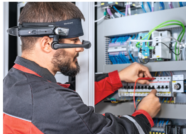
Techniker vor Ort

Sparen Sie Zeit dank sofortiger Lösungen und Support rund um die Uhr nach Ihren Wünschen. Sie können jetzt Ausfallzeiten verringern oder in manchen Fällen sogar ganz vermeiden, indem Sie die Probleme mit Unterstützung unseres Supportteam selbst lösen. Wählen Sie den verfügbaren Techniker aus unserem Team im Anzeigefeld von WOLFF Assist aus – und schon steht Ihnen die benötigte Unterstützung jederzeit zur Verfügung.